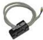
23101125 Safety microswitch kit on the door Kit Microswitch di sicurezza sullo sportello