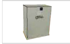
Stainless steel cover (option) Cover in acciaio inox (optional)