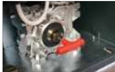
Release with personalized key Sblocco con chiave personalizzata