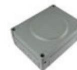
MC424L 1 CENTRALITA DE MANDO.